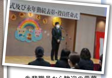
先輩職員から歓迎の言葉