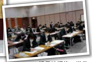
採用時研修の様子