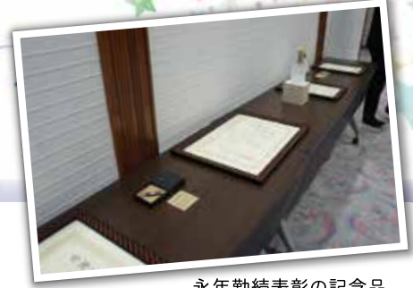
永年勤続表彰の記念品