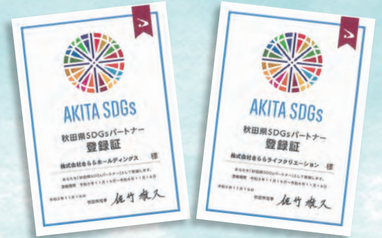
11月19日にきららホールディングス、きららライフクリエーションが秋田県SDGsパートナーの登録をいたしました!