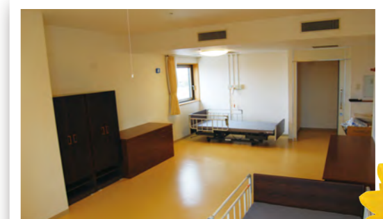
二人（夫婦）部屋。ワードローブ・チェスト 電動ベッド完備。