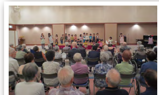
きらら保育園の子どもたちの歌と踊りを鑑賞。 ニコニコ笑顔とパワーを頂きました。