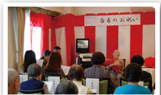
白寿のお祝い。 利用者様・ご家族様・職員でお祝い。