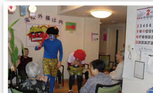
鬼に扮した職員と楽しく豆まき。